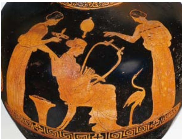
6 | Raum III Vitrine 2–3

Die Bildungsmöglichkeiten von Frauen waren auch im kulturellen Zentrum Athen nicht allzu beeindruckend. Man wird davon ausgehen können, dass ihre Erziehung vor allem im Bereich des Hauses vor sich ging und meist Grundkenntnisse umfasste. Doch Vasenbilder mit lesenden Frauen und die Besitzerangabe auf verschiedenen Gegenständen, die Frauen gehörten, zeigen eindringlich, dass Frauen in der griechischen Antike häufiger lesen und schreiben konnten, als mitunter angenommen wird.