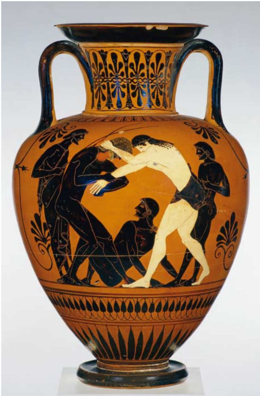
24 | Raum V Vitrine 16