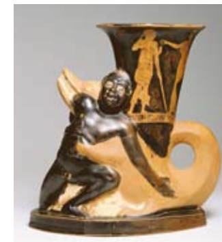
25 | Raum V Vitrine 16

So sehr Atalante einzigartig wirkt: Der griechische Mythos kennt neben Atalante auch noch andere berühmte Jägerinnen, so Kyrene – die Namensgeberin der Stadt im heutigen Libyen – oder Prokris in Athen. Vor allem Atalante hat die antike und abendländische Bildkunst aber durch die Jahrhunderte begeistert.