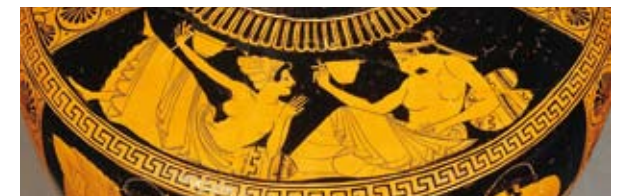
7 | Raum III Vitrine 2–3

Und dann gab es die stadtbekanntesten Hetären. Sie nahmen unter anderem an den sonst nur Männern vorbehaltenen Gelagen teil und praktizierten dort Künste mannigfaltiger Art: Und so gehörten musische Bildung, angenehme Konversation und erotische Kenntnisse zu ihrem Berufsbild.